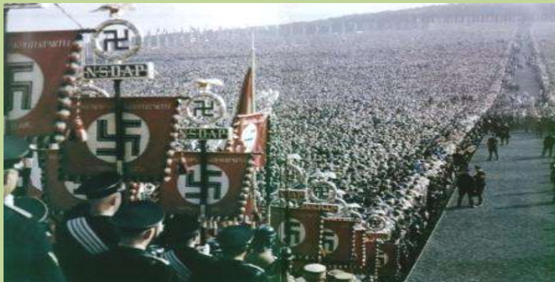
در این تصویر تاریخی بخوبی خیل مریدان و پیروان هیتلر مشخص است!

آری او با درک نبوغ آمیز این ترفند ساده اما کارساز بود که توانست با جهشی خیره کننده از جوانکی فقیر و بی سرپناه و سرگردان در خیابانهای وین، در کوتاه مدت تبدیل شود به صدراعظم و پیشوای آلمانها و حتی پروردگار آنها!